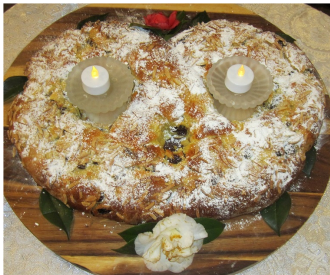
DV Pertas nodaļas 73 darbības gada kliņģeris.